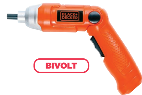
PARAFUSA E DESPARAFUSA