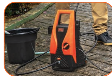
Função AUTO SUÇÇÃO