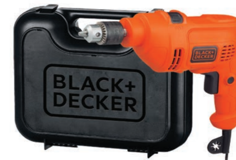
OPÇÃO TM500K COM MALETA.