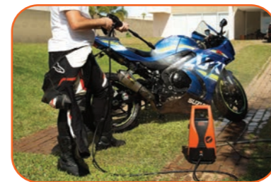
Limpeza de bicicletas, carros e motos