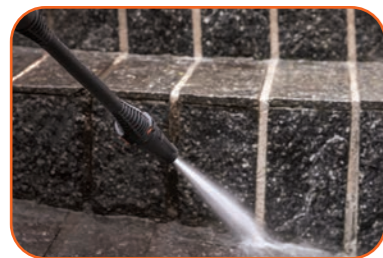
Limpeza de pátios, calçados e terraços

80% mais vida útil com bomba de alumínio BOMBA DE ALUMÍNIO GARANTINDO MAIOR VIDA ÚTIL DA MÁQUINA